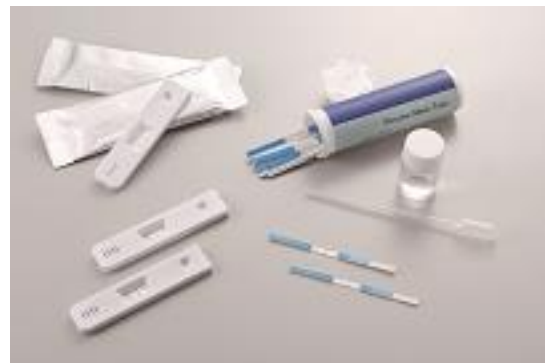
検査キットとしての製品化例

(※1) ジカウイルス：ジカウイルスはジカウイルス感染症の原因となるウイルス。通常、ジカウイルスはジカウイルスを持った蚊に刺されることによって感染するが、胎内感染することも明らかになってきている。その他、輸血や性行為による感染の可能性も指摘されている。