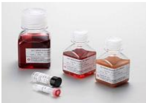
試薬に使用される金コロイド

現行の、血液中に存在するZIKVの検出方法には、特別な設備を必要とする遺伝子増幅法 (※6) が用いられていますが、検出には半日から1日程度の時間を要します。しかし、本試薬では検体を試薬に浸透させるだけでZIKVの検出が可能であり、また、既に実用化されているインフルエンザウイルスの検出試薬と同様に10～15分という手軽に短時間で検出することができます。さらには、遺伝子増幅法のように特別な設備を必要としないため、使用者のコスト削減にも繋がります。