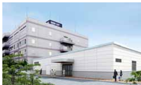
専用工場のイメージパース